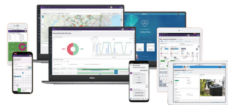
レスポンスなデザイン 作業環境に応じて、最適な表示を実現